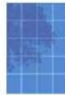
Ombreggiamento (attuale o futuro)